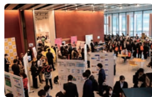
2023全国大会in茨城の様子。 今年度は11月島根県開催！

日本介護福祉士会と都道府県介護福祉士会が連携して、国民のニーズに応えた介護・福祉の充実や質の向上のため、活動しています。各種研修や全国大会の開催など、皆さんとより近い距離で活動しています。